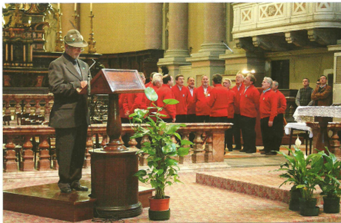
Messa con coro Scricciolo

Chiunque fosse interessato a ricevere La Nuova Rusgia al di fuori del territorio di Cameri, può rivolgersi alla Pro Loco, via Novara, 20 o scrivere una e-mail all'indirizzo: cameri.proloco@libero.it