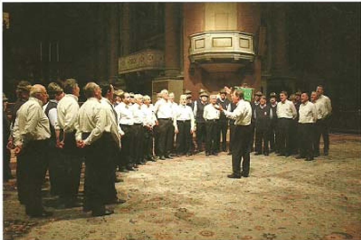
I casti matti

Nel 1997 cominciarono i lavori di recupero dell'attuale sede di Via Novara. Le superfici messe a disposizione dall'Amministrazione Comunale permisero di continuare il contributo A.N.A. "A. Zappa" ed il Coro Sericciolo. Al piano terra la sede alpini; al primo piano l'ufficio, la cucina e la grande sala riunione. Quest'ultima, dal 2000, divenne l'attuale sede del Coro. Anche i lavori di ristrutturazione vennero realizzati congiuntamente; le gravose attività di demolizione, ricostruzione, pavimentazione, idraulica, ecc. a cura degli alpini; progettazione elettrica, realizzazione della relativa impiantistica, parte dei lavori di falegnameria e qualche finitura a cura di alcuni coristi.